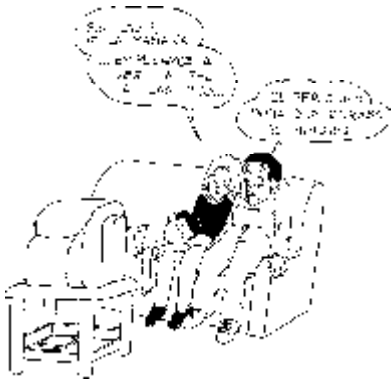
33. Derecho a ver las «pelis» enteras, de un tirón, sin anuncios publicitarios de longitud kilométrica.