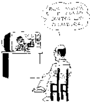
35. Derecho a ver las «pelis» enteras, en versiones actualizadas, sin la censura de antes, sin cortes de producción.