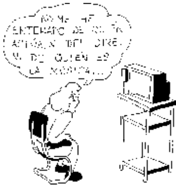
34. Derecho a ver las «pelis» enteras sin que corten los créditos por delante y por detrás.