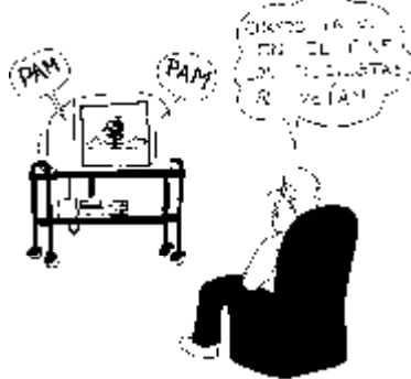
36. Derecho a ver las «pelis» enteras, por la derecha y por la izquierda, en los formatos en que se hicieron.