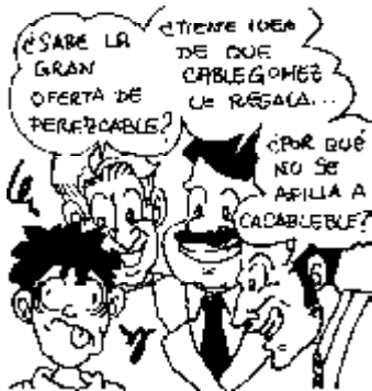
54. Derecho a elegir sin presiones el sistema de tele que nos parezca conveniente.