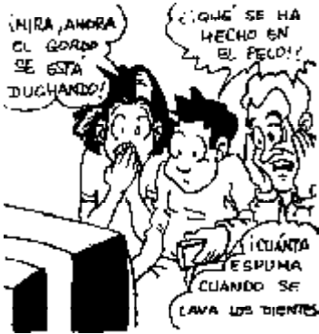
52. Derecho a que nos metan en casa la vida de los otros.