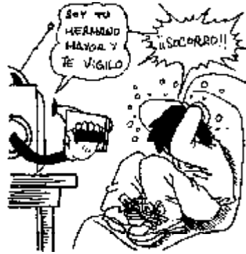
53. Derecho a la intimidad de los televidentes.