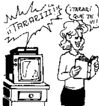
55. Derecho a engañar al audímetro.