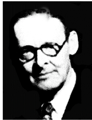
T. S. Eliot Poeta norteamericano 1888 -1956

La Humanidad no puede soportar mucho realidad