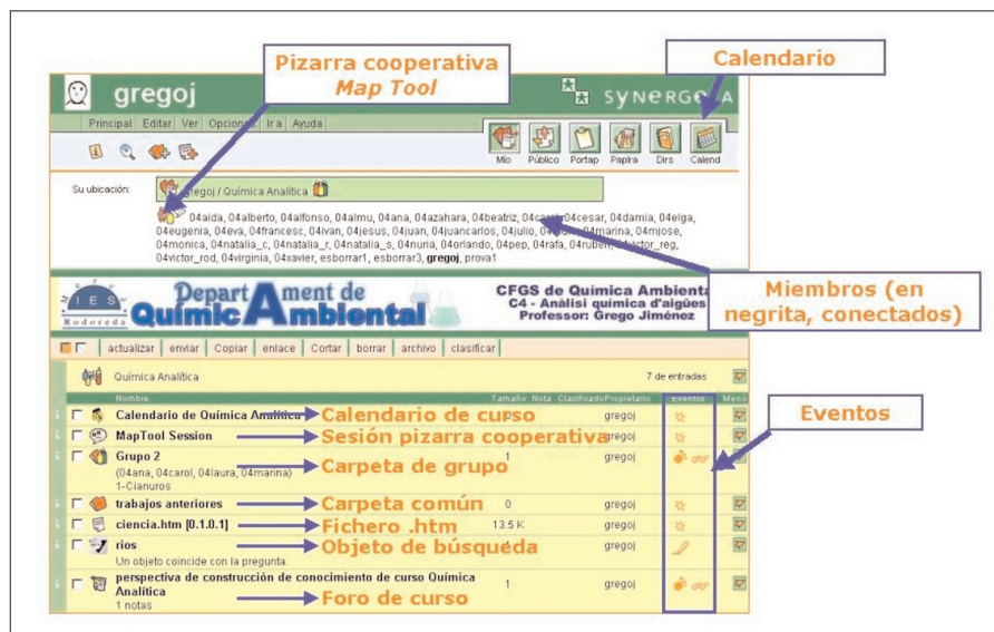
Figura 1: Interior de una carpeta de curso.