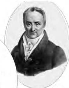
Philippe Pinel (1745-1826)