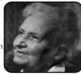
Maria Montessori, 1870-1952, educadora y doctora italiana Su método recibió mucho del Dr. Itard