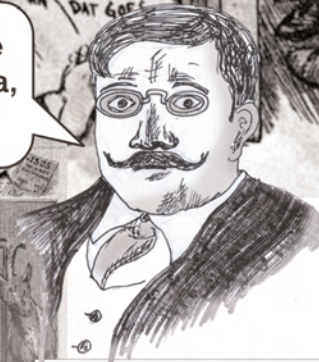
Richard Felton Outcault Guionista, pintor y dibujante de historietas estadounidenses (1863-1928)