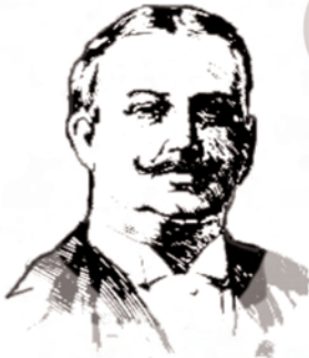
Frederick Remington (1861-1909)

Hearts envió un telegrama al dibujante Remington