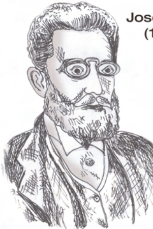
Joseph Pulitzer (1847-1911) William Randolph Hearst (1863-1951)

Los dos grandes magnates de la prensa, Hearst y Pulitzer mantuvieron la tira «Yellow Kid». El «New York Times» bautizó a los rotativos de ambos como «prensa amarilla». Desde entonces, la prensa sensacionalista se conoce con tal