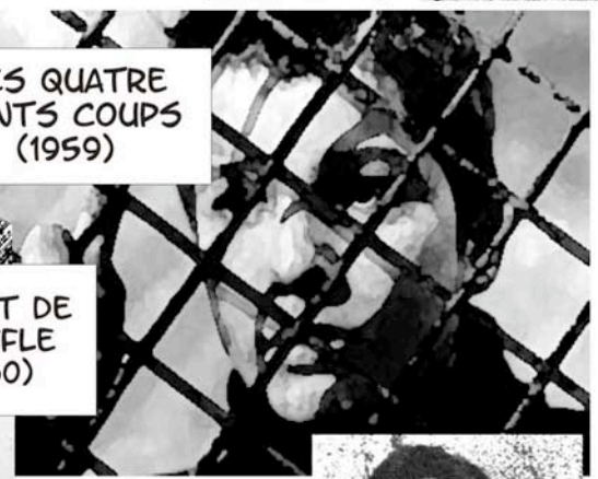
À BOUT DE SOUFFLE (1960)