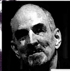
INGMAR BERGMAN (1918- 2007)