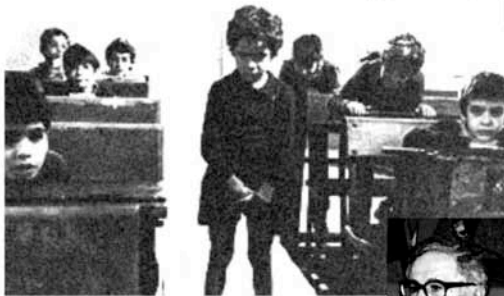
PADRE PADRONE (1977)