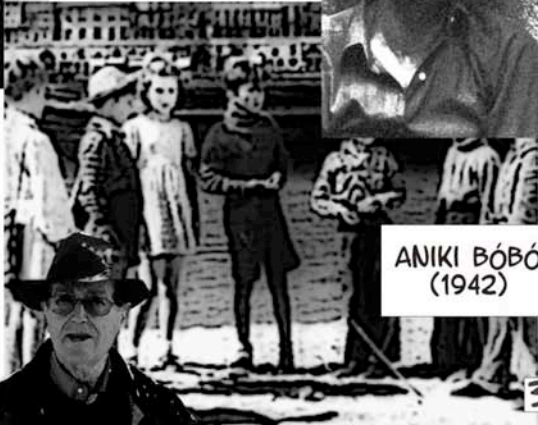
ANIKI BÓBÓ (1942)