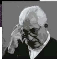
JUAN ANTONIO BARDEM (1922-2002)