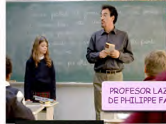
PROFESOR LAZHAR, 2011 DE PHILIPPE FALARDEAU