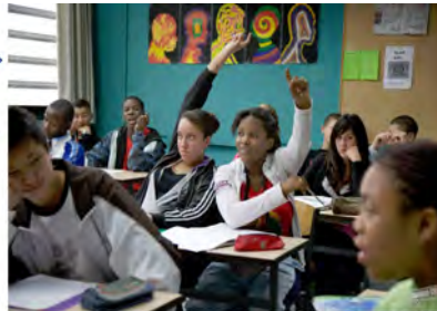
EL APRENDIZAJE DE LA DEMOCRACIA PUEDE IMPLICAR CIERTOS RIESGOS

RESOLUCIÓN DE CONFLICTOS, VALORES, NORMAS, CONVIVENCIA Y DIVERSIDAD