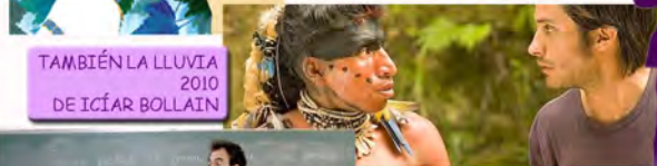
TAMBIÉN LA LLUVIA 2010 DE ICÍAR BOLLAIN