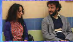
UN NOVIO PARA YASMINA 2008 DE IRENE CARDONA BACAS