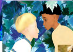
AZUR Y ASMAR 2004 DE MICHEL OCELOT