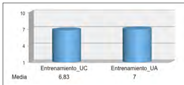
Figura 3. Media de las puntuaciones de la apreciación de la propia participación en los debates online (puntuación máxima=10).

La propuesta pedagógica en educación ética aquí descrita refleja la necesidad de plantear y desarrollar iniciativas de este tipo en el ámbito universitario, dada la acogida positiva de todos los participantes -profesores y estudiantes- y su reflejo en los resultados obtenidos. Consideramos que esta propuesta concretiza en las aulas universitarias la difícil tarea de formar a pro-