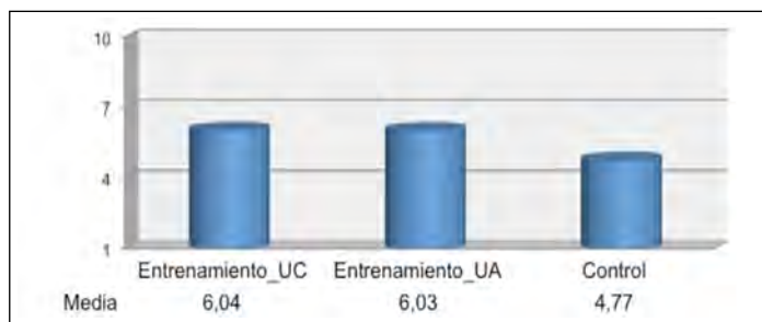
Figura 1. Media de las calificaciones en cada una de las condiciones (puntuación máxima = 10).

Como podemos observar en la figura 1, los estu-