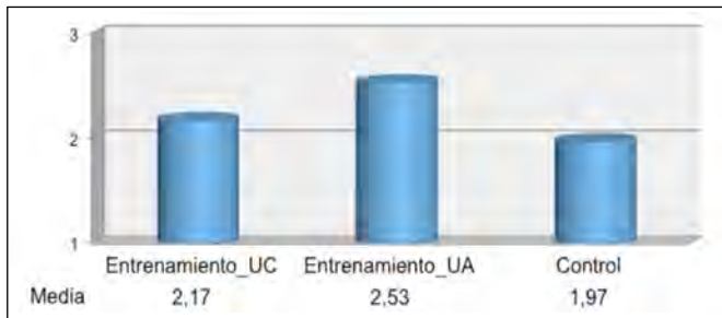
Figura 4. Media de las puntuaciones de la apreciación de la calidad de la propia participación en los debates (puntuación máxima=3).

fesionales integrales, que unida a su preparación científica y técnica, les permita construir y generalizar su compromiso social y formación humanística (Hodelín & Fuentes, 2014).