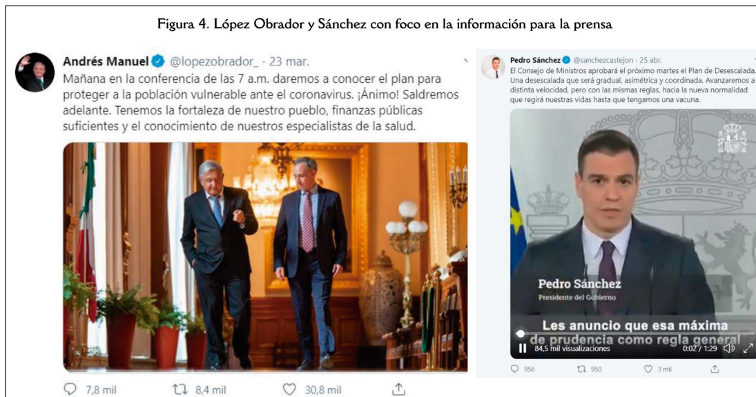
Figura 4. López Obrador y Sánchez con foco en la información para la prensa

rueda de prensa y también el símbolo de la rosa, que representa al Partido Socialista. AF usa emojis e incluso un sticker que lo representa creado con un iPhone, desde donde publica la mayoría de sus tuits. También la emoción cruza la variable de la personalización dado que la mayoría de los mensajes dirigidos a sus seguidores son afectuosos, expresando una cercanía que no siempre queda clara que sea real (a veces usa expresiones indicando familiaridad) o que intenta marcarse.