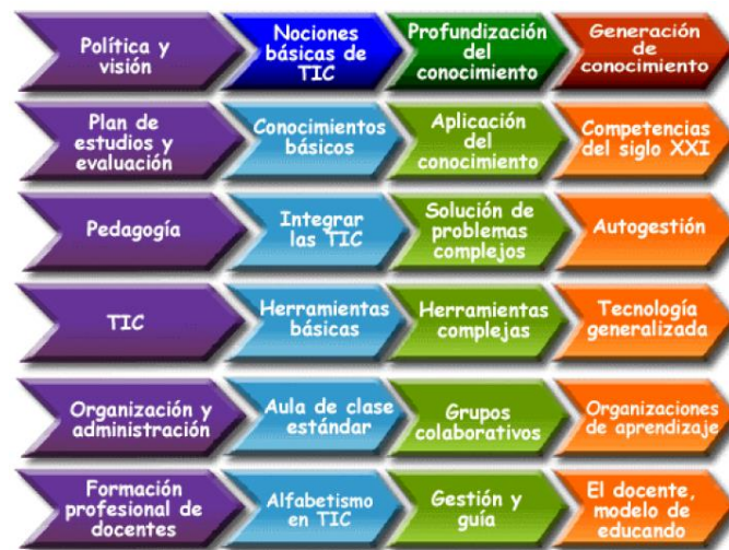
Figura 2. Módulos UNESCO para las competencias TIC para docentes (UNESCO, 2008).

El objetivo del proyecto ECD-TIC de la UNESCO es la elaboración de un marco de estándares UNESCO de competencias en TIC para docentes (ECD-TIC), que podemos observar en la figura 2: