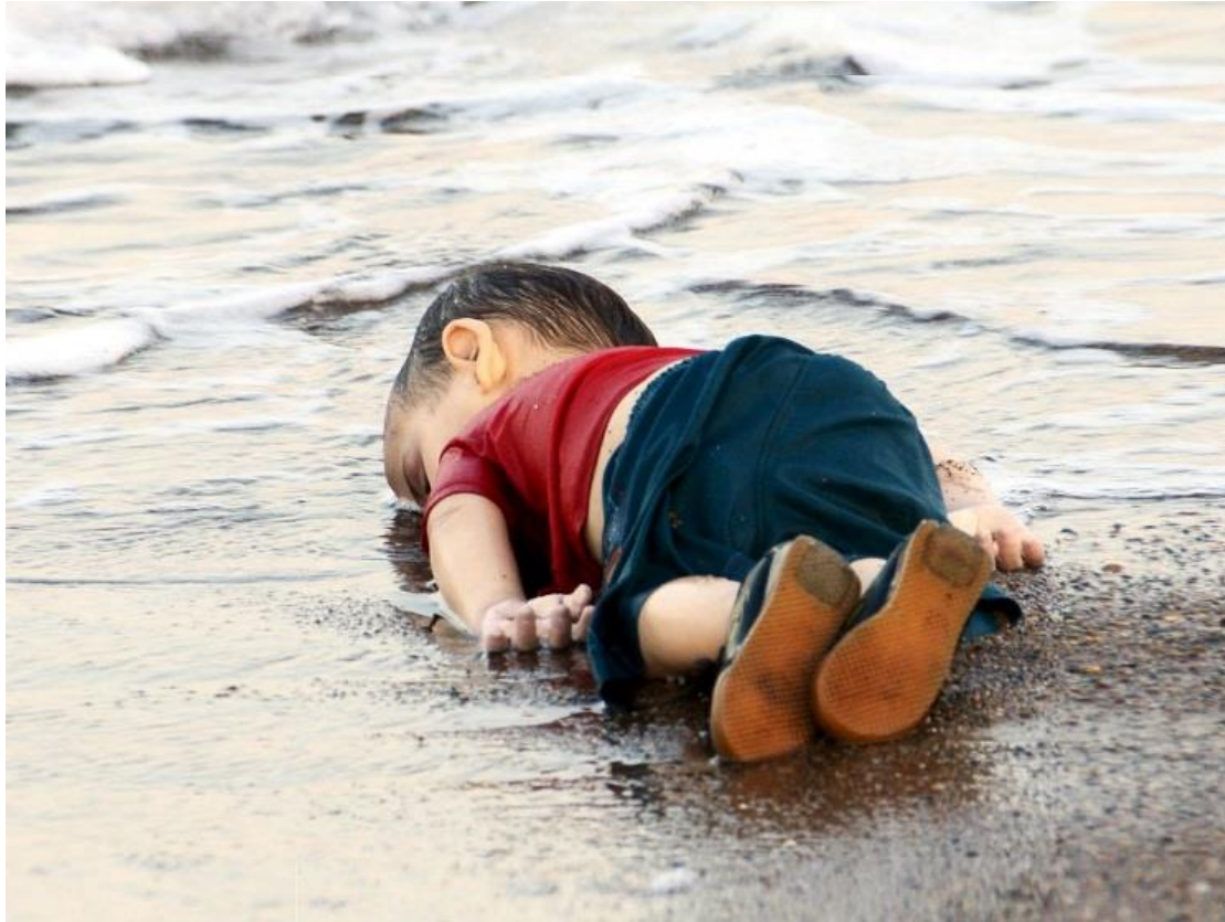
Imagen 1. Fotografía de Aylan Kurdi. Autora: Nilüfer Demir/Agencia Dogan (Reuters, 2015).

En un primer plano descriptivo, nos hallamos ante la imagen del cuerpo de un niño. Un niño muerto y solo. Precisamente esa es la primera razón por la que la imagen nos impresiona. Nos encontramos ante el cuerpo de un niño blanco, con la ropa mojada: su camiseta roja, sus pantalones cortos azules y las suelas de calzado sin apenas deterioro; tendido boca abajo en la arena mojada de la playa, las olas de un mar en calma apenas rozan su rostro, el cual percibimos a pesar de que la imagen de su cara solo se ve parcialmente. En este caso las ropas intactas del niño, el color vivo y cálido de la camiseta, el calzado nuevo, nos alejan del estereotipo del niño «pobre», no caucásico, con las ropas deterioradas y los pómulos hundidos que se repite en las portadas de los diarios o en las piezas de los informativos de televisión. En esta imagen cualquier observador sentiría que se trata de un niño dormido al que se podría retirar de la orilla evitando así el peligro de ahogarse. La paradoja de la imagen de vida a pesar de su muerte. La mente humana puede tratar de encubrir la realidad y percibir que se tratara de un muñeco, por esa palidez, como de cera, que refleja el fragmento del rostro que se le muestra al observador.