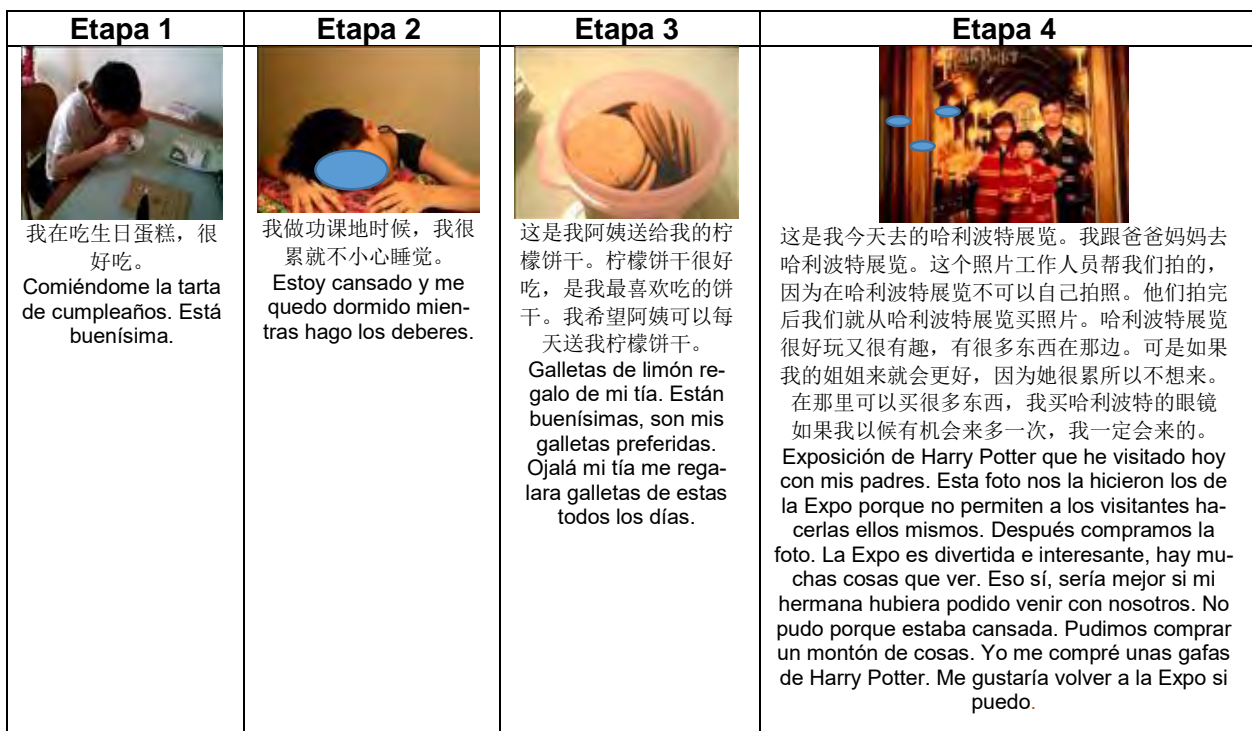
Figura 4. Cuatro instrumentos socialmente auténticos creados por el mismo estudiante en las diferentes etapas con su correspondiente traducción. [En la versión original la traducción es chino-inglés].

Esta imagen ejemplifica un instrumento socialmente significativo creado por el mismo estudiante a lo largo de las cuatro etapas, y nos proporciona a la vez pistas importantes sobre el desarrollo en la dinámica del entorno de las redes sociales. En las primeras fases, los estudiantes no estaban familiarizados con el uso de las redes y consideraban este tipo de actividades como un ejercicio de