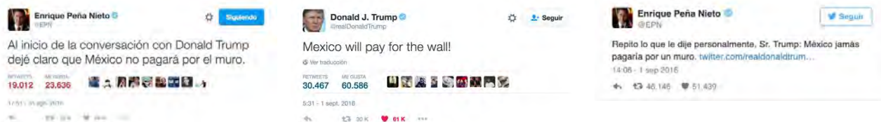
Figura 2. La disputa discursiva por el muro fronterizo.

El 1 de septiembre, la conversación continuaba. El presidente mexicano envió un segundo tuit ratificando el del día anterior, el cual sería refutado por el candidato quien en otro tuit reafirmó que México pagaría el muro. Para los republicanos había sido un triunfo, en tanto que para la candidata demócrata Hillary Clinton el intercambio de tuits demostraba que su contrincante mentía y había avergonzado a Estados Unidos (Merica, 2016).