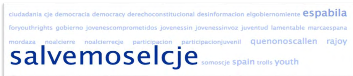
Figura 3. Relevancia de los hashtags relacionados el 11 de Septiembre de 2014.

La Figura 3 ilustra la relevancia de cada uno de los hashtags que fueron utilizados durante la campaña. El tamaño de la letra es proporcional a la frecuencia de aparición.