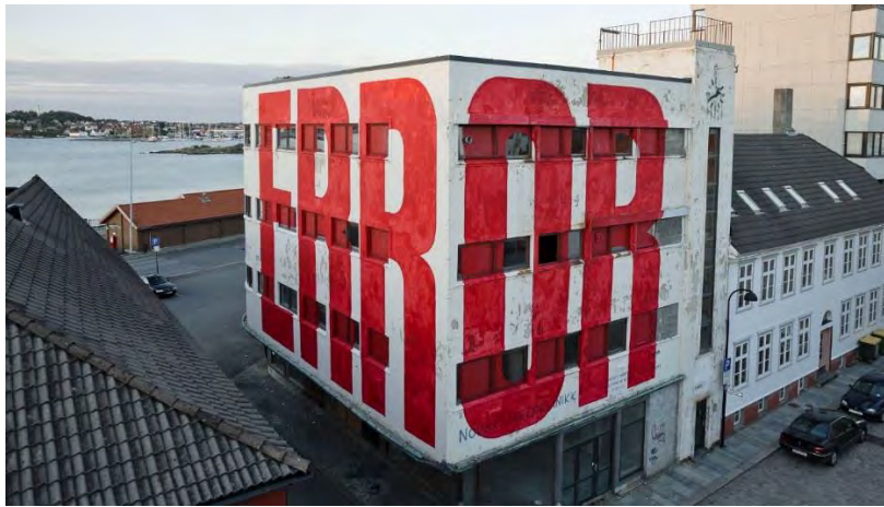
Gráfico 1. Del artista madrileño SpY, pintura en Stavanger (Noruega) ( http://spy-urbanart.com ).

El lenguaje del activismo es múltiple y generativo, no respeta las reglas culturales fijas. Como apunta Abarca (2016: 5), «gracias a la naturaleza no regulada de su práctica, un artista urbano puede ignorar los límites dictados por la propiedad privada que determinan dónde puede o no puede actuar. Una obra de arte urbano puede cubrir simultáneamente dos o más superficies contiguas pertenecientes a diferentes dueños, ignorando así la división de materia y espacio demarcada por el dinero. El arte urbano puede por tanto hacer visible cómo estos límites de acción y estas demarcaciones físicas son arbitrarias y culturales. Puede devolver el espacio y la materia a su estado natural, cuando todo era de uso de todos y nadie poseía realmente nada».