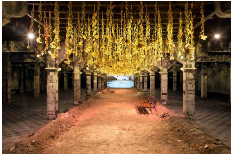
Gráfico 8. Basurama ( https://bit.ly/2JXExDt ).

Un ejemplo español similar es el del colectivo Basurama, fundado en 2001, que constituye un ejemplo de prácticas de creatividad activista que ha centrado su área de estudio y actuación en los procesos productivos, y la generación de desechos que estos implican. Su proyecto «Agostamiento» fue una intervención site-specific dentro del programa «Abierto x Obras» que tiene lugar en la antigua cámara frigorífica del Matadero en Madrid. El colectivo propuso un paisaje interior extraído de la plantación de 7.000 girasoles que había cultivado junto a los vecinos y vecinas de la Gran Vía del Sureste, en el Ensanche de Vallecas, un barrio símbolo de la burbuja inmobiliaria. Su creación, en palabras de Basurama, «invita a charlar y a comer pipas, mirando hacia el futuro desde lo más oscuro». Este proyecto fue realizado en Madrid en 2016.