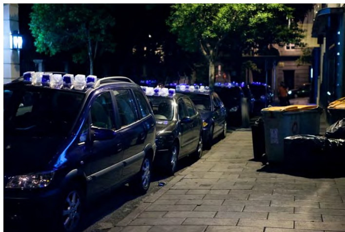
Gráfico 7. Luzinterruptus ( https://bit.ly/1w4GZPw ).

En España, la crisis económica de los últimos años, se ha convertido en verdadera incubadora para el artivismo. Luzinterruptus, grupo colaborativo y anónimo creado en 2008 que trabaja en grandes ciudades como Madrid y Berlín, se caracteriza por realizar intervenciones en el espacio público utilizando la luz como materia prima. En 2014 llevaron a cabo en Madrid su acción-denuncia. La policía está presente, un rechazo a la conocida popularmente como Ley Mordaza en referencia a la Ley Orgánica de Protección de la Seguridad Ciudadana, aprobada por el Partido Popular en julio de 2015.