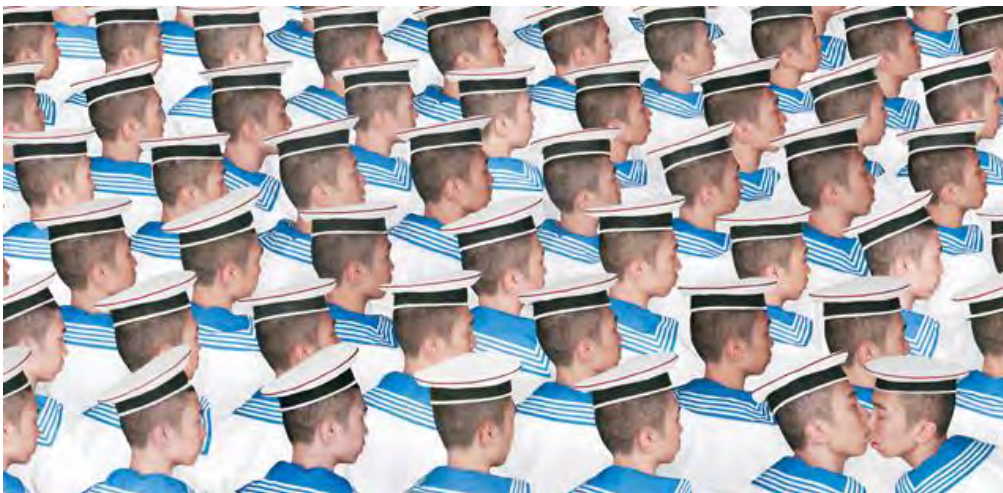
Gráfico 5. Obra de Wang-Zi (VärldskulturMuseerna: https://bit.ly/2rick3d ).

Especialmente interesante es el caso de China donde bajo una aparente tranquilidad, se han ido desarrollando formas de protesta activista de gran alcance. Una de las más célebres es el activista chino Ai Wei Wei. Un caso excepcionalmente importante es el del activista Wang-Zi. En su condición de homosexual, algo considerado delito en su país, ha recurrido al arte popular de los recortes de papel que constituyen un recuerdo cultural colectivo, para representar la vida y las emociones del individuo homosexual. Wang-Zi ha ido incorporando nuevas formas de expresión artística a su repertorio.