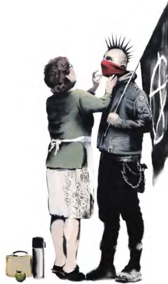
Gráfico 4. Banksy. Página web del artista ( www.banksy.co.uk ).

Especialmente interesante es el caso de China donde bajo una aparente tranquilidad, se han ido desarrollando formas de protesta activista de gran alcance. Una de las más célebres es el activista chino Ai Wei Wei. Un caso excepcionalmente importante es el del activista Wang-Zi. En su condición de homosexual, algo considerado delito en su país, ha recurrido al arte popular de los recortes de papel que constituyen un recuerdo cultural colectivo, para representar la vida y las emociones del individuo homosexual. Wang-Zi ha ido incorporando nuevas formas de expresión artística a su repertorio.