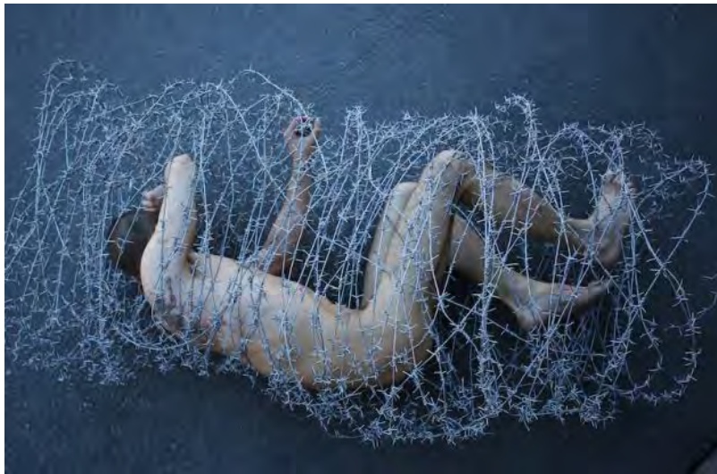
Gráfico 2. «Carcass», de Pier Pavlensky. Performance en Moscú (2008).

Como analiza Kombarov (2017: 2), experto en la obra del activista Pier Pavlensky, cuya performance en Moscú vemos en la ilustración superior, el activismo es un medio de expresión eficaz porque no individúa la expresión, sino que, «dividiéndola», es decir, rompiéndola o dividiéndola precisamente en planos diversos a los habituales, resemantiza la presencia humana. Kombarov considera el activismo como un nuevo lenguaje, diferente al de los medios de comunicación, la publicidad y la industria cultural. Este nuevo lenguaje apela a la subjetivización, al uso del cuerpo, y otros sistemas diversos de comunicación para eludir la pérdida de significados.