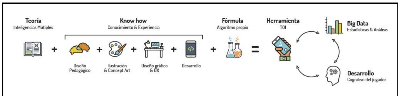
Figura 1. Descripción gráfica del Método TOI.

TOI se desarrolla a partir de un innovador y minucioso proceso del mismo nombre, el Método TOI (Figura 1). Partiendo de la concepción del intelecto humano de Gardner (2013), y teniendo en cuenta que las inteligencias trabajan siempre en concierto (Armstrong, 2006; Gardner, 2013), que se disparan a partir de información presentada de forma interna o externa (Gardner, 2013) y que existen diferentes maneras de ser inteligente dentro de una misma inteligencia (Armstrong, 2006), se diseñan mecánicas de juego que plantean retos lógicos, visuales, naturalistas, lingüísticos, corporales, emocionales y musicales. El rendimiento de la persona a la hora de resolver los diferentes retos determina su perfil de inteligencias.