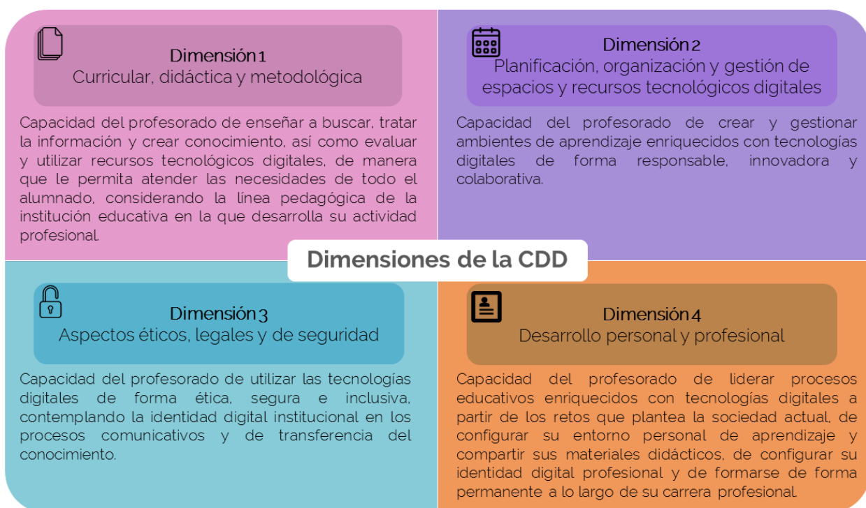
Figura 1. Dimensiones de la CDD.

Con este propósito, este estudio pretende analizar el nivel de desarrollo de la CDD en una muestra de estudiantes de último año de FID en Chile y Uruguay, mediante un instrumento previamente validado (ver sección 2.2), que nos permite realizar una evaluación alineada a los indicadores y dimensiones de la CDD propuesta por Lázaro y Gisbert (2015) (Figura 1). A su vez, mediante los datos obtenidos, también se estudiará la relación del nivel de CDD con otras variables clave.