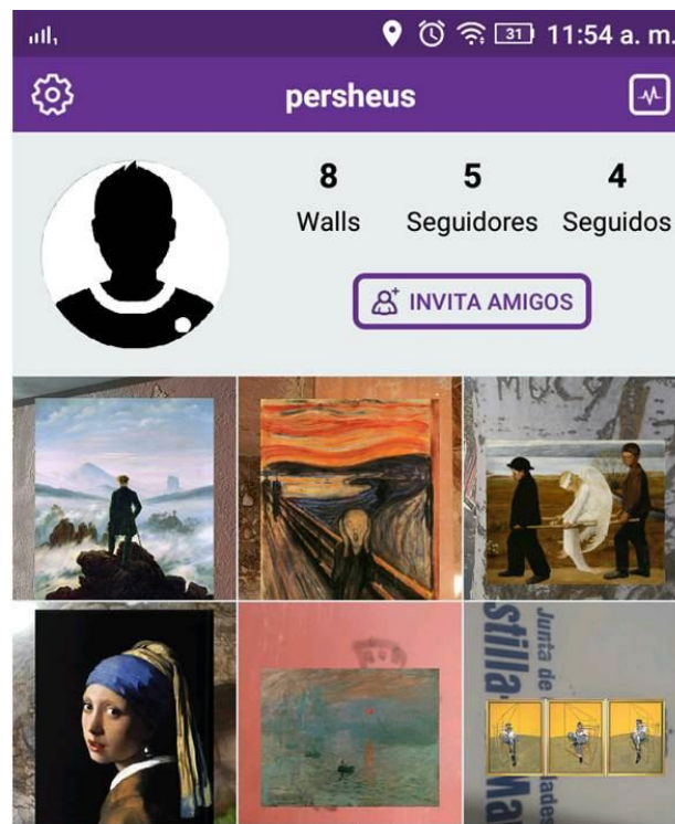
Figura 2. Uso de «WallaMe» con trabajos artístico. Captura en teléfono móvil.

Una vez que los dos grupos han recibido las cinco sesiones, se somete a ambos al postest que permitirá evaluar el rendimiento académico del alumnado en relación a los contenidos impartidos de la unidad didáctica. Además, se aplica un cuestionario de escala Likert de 1 a 5 para analizar las variables de motivación, compromiso, diversión y colaboración en ambos grupos.