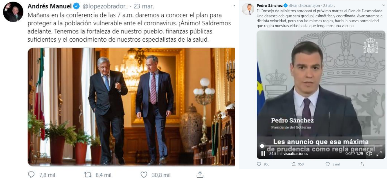
Figura 4. López Obrador y Sánchez con foco en la información para la prensa