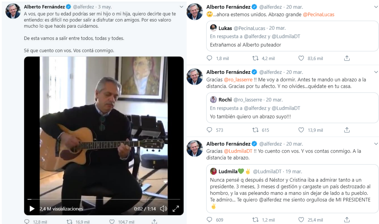
Figura 3. Narrativa pop y personalismo en la cuenta de AF

Le sigue en proporción LO, con un 12% de las publicaciones (32 tuits) dedicados a mensajes personales, aunque lejos de la familiaridad y la interacción de AF. En la cuenta de JB la expresión de la personalidad se evidencia en la inclusión de algunos eventos evangélicos, citas bíblicas y algunos paseos por fuera del protocolo donde muestra los saludos en la calle. También saluda contestando a algunas cuentas, especialmente resaltando su relación cercana con otros líderes mundiales (Rudy Guilliani, Xi Jin Ping, Trump); agradece las entrevistas de su agrado y festeja el crecimiento en las redes sociales. Menciona la evolución de su análisis médico del virus. Incluye el matiz religioso con citas bíblicas y menciones directas a «Deus» (19), incluyendo su eslogan «Deus acima de todo» (6 veces): «19/3/20 0:42 Nunca abandonarei o povo brasileiro, para o qual devo lealdade absoluta! Boa noite a todos!».