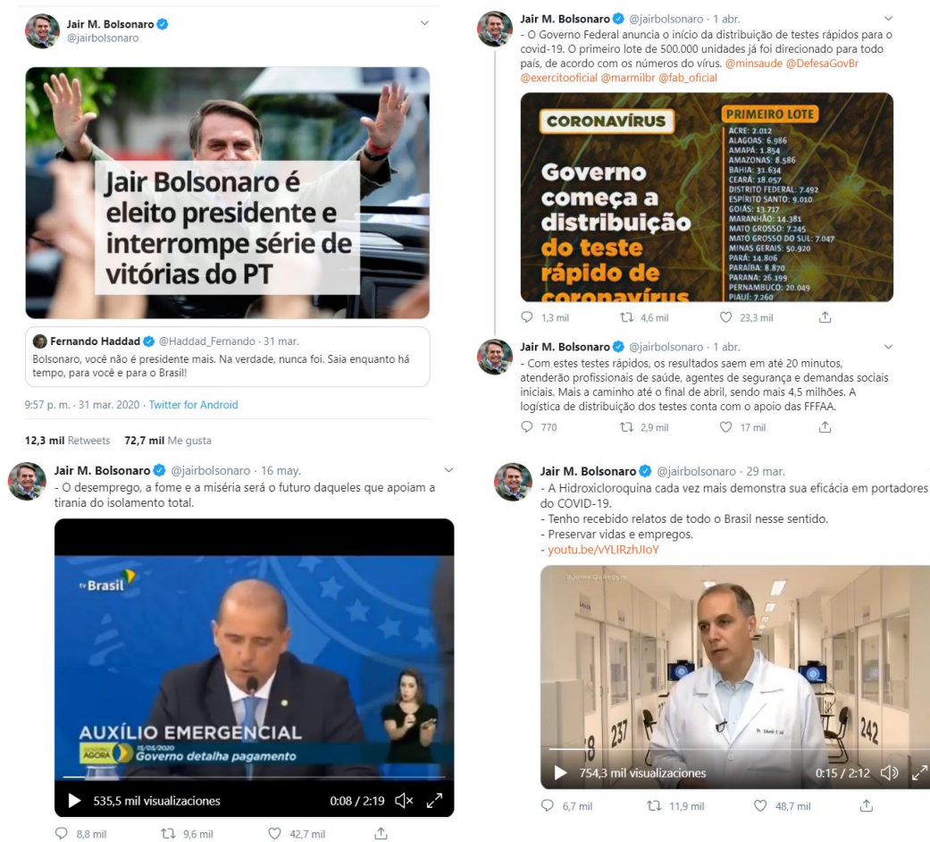
Figura 2. Posicionamiento en Twitter de JB

Un indicador a considerar para entender la actividad de las cuentas presidenciales durante la pandemia es analizar las tendencias de la comunidad de seguidores. El pico de nuevos seguidores en la cuenta de LO responde a un mensaje personal de 10 minutos desde el jardín del Palacio Nacional, con sonido de pájaros de fondo, donde se pone como ejemplo de quedarse en guardia en domingo por recomendación del ministro López-Gattel, dos días después de la reunión con Donald Trump. Da consejos personales y agradece a este presidente y al de China.