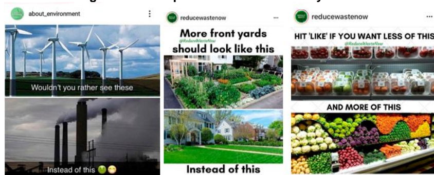
Figura 5. Contraposiciones mediante disyuntivas

Para terminar, en la Figura 6 mostramos ejemplos que construyen la narrativa en base a distintas temporalidades que implican causalidad, pero con actores y tonalidades emocionales muy distintas. La primera se refiere a un pasado próximo y un futuro cercano, y utiliza el meme de los Simpson; es Simpson quien vierte plásticos al mar y quien recibirá las consecuencias apocalípticas. Este es un claro ejemplo de meme popular adaptado a la cuestión medioambiental, copiando un patrón de un meme icónico de este tipo (como el caso del que usa dos fotogramas del videoclip «Hotline Bling» del cantante Drake que vemos en la segunda imagen). En los memes analizados encontramos que el humor se utiliza en contadas ocasiones y para la ridiculización de un comportamiento inadecuado, para mostrar las dificultades y contradicciones de los propios activistas para conseguir una vida sostenible, o para la denuncia de una «falsa creencia» como el negacionismo del cambio climático. La tercera imagen, usando un mismo esquema antes-después, es una temporalidad mucho más corta, en el presente, y hay una individuación completa (es a «mí» a quien se le rompe el corazón); esta identificación con el yo individual incorpora el máximo de nivel emocional, que vincula el dolor del árbol con el dolor de uno mismo.