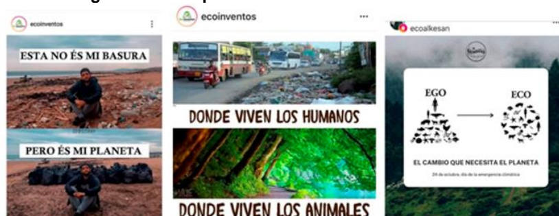
Figura 3. Contraposiciones en dos órdenes o estados

La cuarta tipología sube el grado de abstracción ya que las imágenes contraponen una causa y su efecto, planteando el dilema de: si haces algo, tendrás una respuesta por ello. Dicho de otro modo, tus actos tienen consecuencias. En estos casos, se individualiza el efecto de un proceso colectivo. En la primera imagen (envenena el río y el río te envenenará a ti) y en la segunda (si priorizas el dinero al medio ambiente acabarás igualmente contaminado), la contaminación por la industria o por un sistema económico capitalista se trueca por la irresponsabilidad y codicia humana. En estos dos casos, una sola imagen condensa la contraposición visual que se hace explícita mediante el texto (Figura 4).