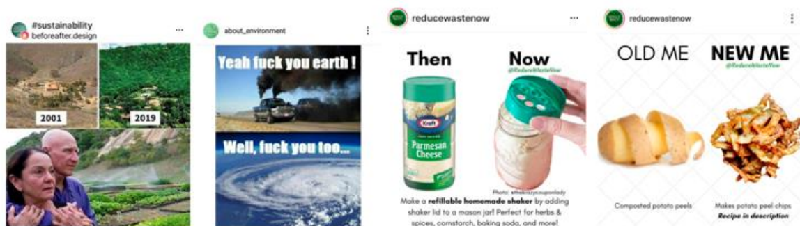
Figura 1. Secuencias de cambio temporal

La primera imagen muestra un cambio en el tiempo: de la desertización a un paisaje irrigado y verde gracias a la acción del fotógrafo Sebastião Salgado y su esposa Lélia Deluiz Wanick. La segunda es una proyección a futuro, cómo podrían ser las cosas, mientras que la tercera y la cuarta muestran una evolución positiva, en lo personal (mediante objetos y alimentos de uso cotidiano) a partir de un aprendizaje relacionado con costumbres más sostenibles. Este tipo de memes («old me-new me») plantean que los cambios a nivel personal afectan al planeta y al medio ambiente. Apelando a la identidad, el «yo» se transforma hacia «otro yo» más responsable, que busca generar empatía y servir de ejemplo.