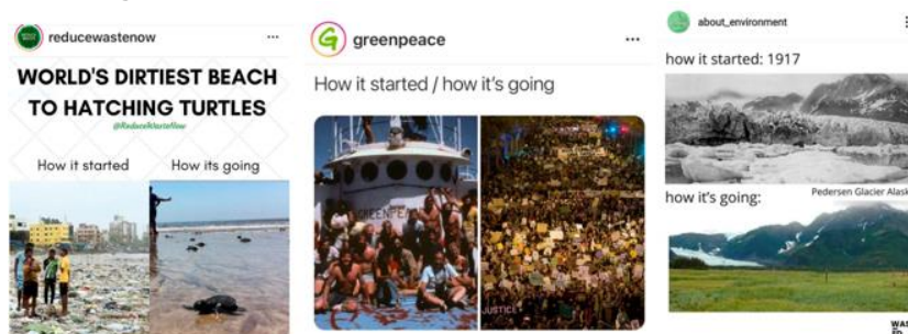
Figura 2. Secuencias de evolución (cómo empezó-cómo va)

En la tercera tipología, el cambio de estado se plantea contraponiendo dos órdenes de cosas, por ejemplo, una imagen de una urbe contaminada con una imagen idealizada de la naturaleza. De nuevo, se apela a lo individual: en la primera imagen de la cuenta @ecoinventos, la contaminación es producto de muchos (y quizás, de otros distintos al individuo en escena) pero la acción parece ser realizada por un solo individuo, reforzando la idea de que «tu» acción tiene un efecto global en el planeta (lo cual implica responsabilidades y beneficios tanto individuales como colectivos). En la segunda imagen vemos una imagen negativa de los humanos frente a los animales (¿dónde prefieres vivir?). La siguiente imagen es quizás la más conceptual, ya que usa la infografía, que se sobrepone a la imagen de la naturaleza. Son pictogramas dispuestos de forma piramidal (evocando el yo, ego, individuo) y en forma de círculo que es más armónico (apelando a lo eco, economía circular, y por ende lo natural). En estos casos no siempre hay un vector temporal claro, sino más bien una disyuntiva (Figura 3).