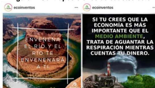
Figura 4. Contraposiciones de causa/efecto

La cuarta tipología sube el grado de abstracción ya que las imágenes contraponen una causa y su efecto, planteando el dilema de: si haces algo, tendrás una respuesta por ello. Dicho de otro modo, tus actos tienen consecuencias. En estos casos, se individualiza el efecto de un proceso colectivo. En la primera imagen (envenena el río y el río te envenenará a ti) y en la segunda (si priorizas el dinero al medio ambiente acabarás igualmente contaminado), la contaminación por la industria o por un sistema económico capitalista se trueca por la irresponsabilidad y codicia humana. En estos dos casos, una sola imagen condensa la contraposición visual que se hace explícita mediante el texto (Figura 4).